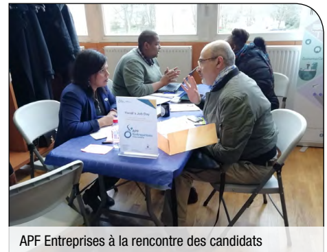
APF Entreprises à la rencontre des candidats

Mais le projet ne s'arrête pas là. Il s'agit maintenant de pérenniser Handi's Job Day sur le territoire du Grand Paris, créer un réseau avec les entreprises présentes, et développer le projet dans les autres délégations.