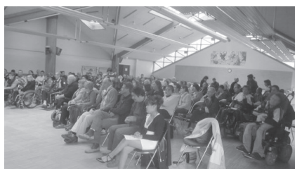
L'Assemblée Départementale s'est tenue à Gouesnou le 19 Avril 2014