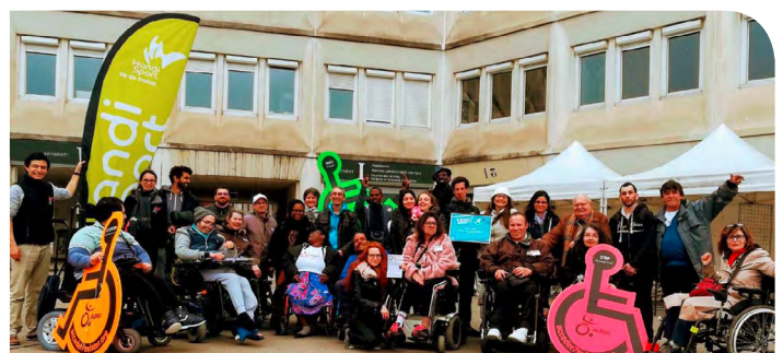
"Venez handiscuter !" le 10 avril à l'UPEC